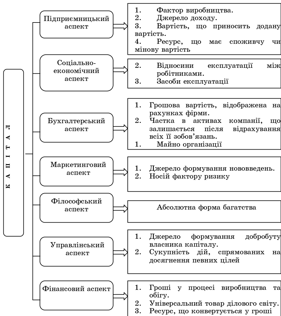
Рисунок 1 - Основні характеристики капіталу

На основі досліджень Кузнецової Т.В. автором систематизовано характеристики капіталу та виділено маркетинговий та управлінський аспекти, які акцентують увагу на основних характеристиках саме нематеріального капіталу (рис.1).