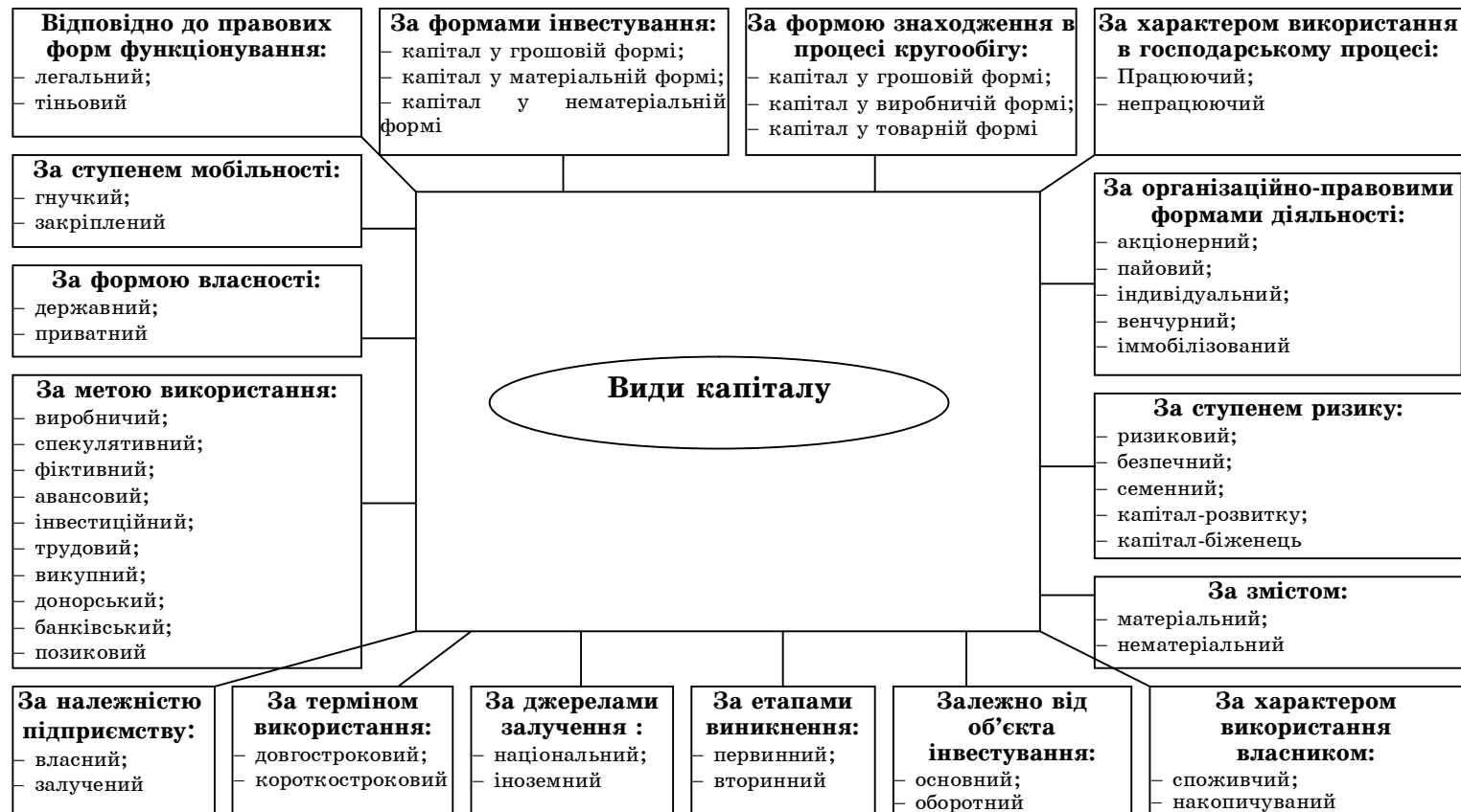
Рисунок 2 – Основні види капіталу